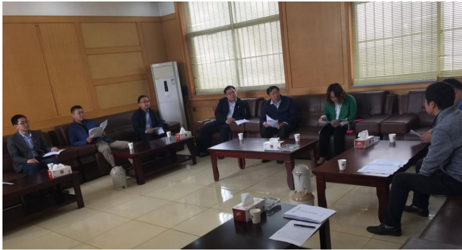
与团市委、团县委对接工作