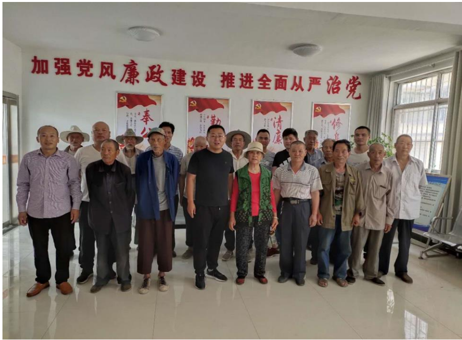
房庄村党支部会后合影