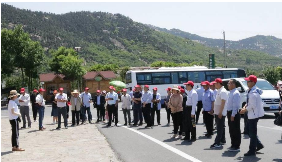
考察美丽乡村建设