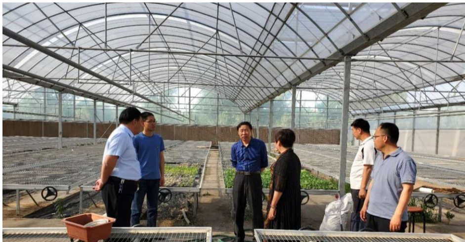
调研大棚扶贫项目