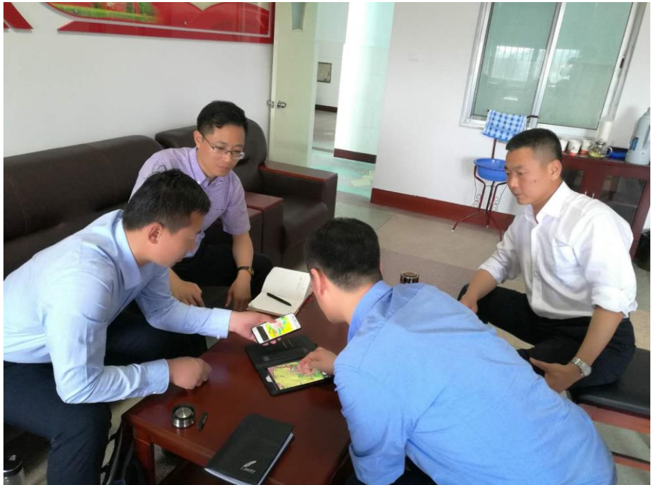
对接建设用地规划