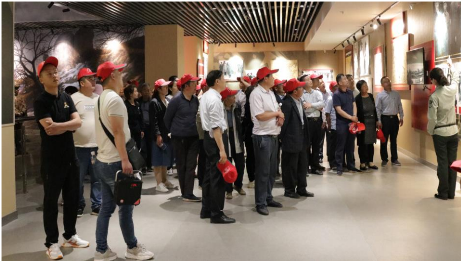
在孟良崮战役纪念馆学习