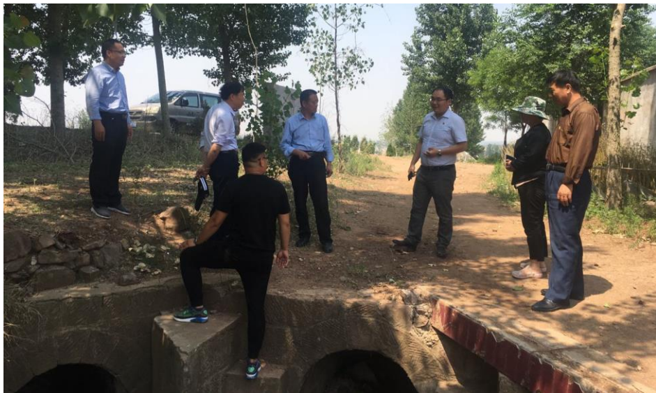
调研灌溉水渠现状