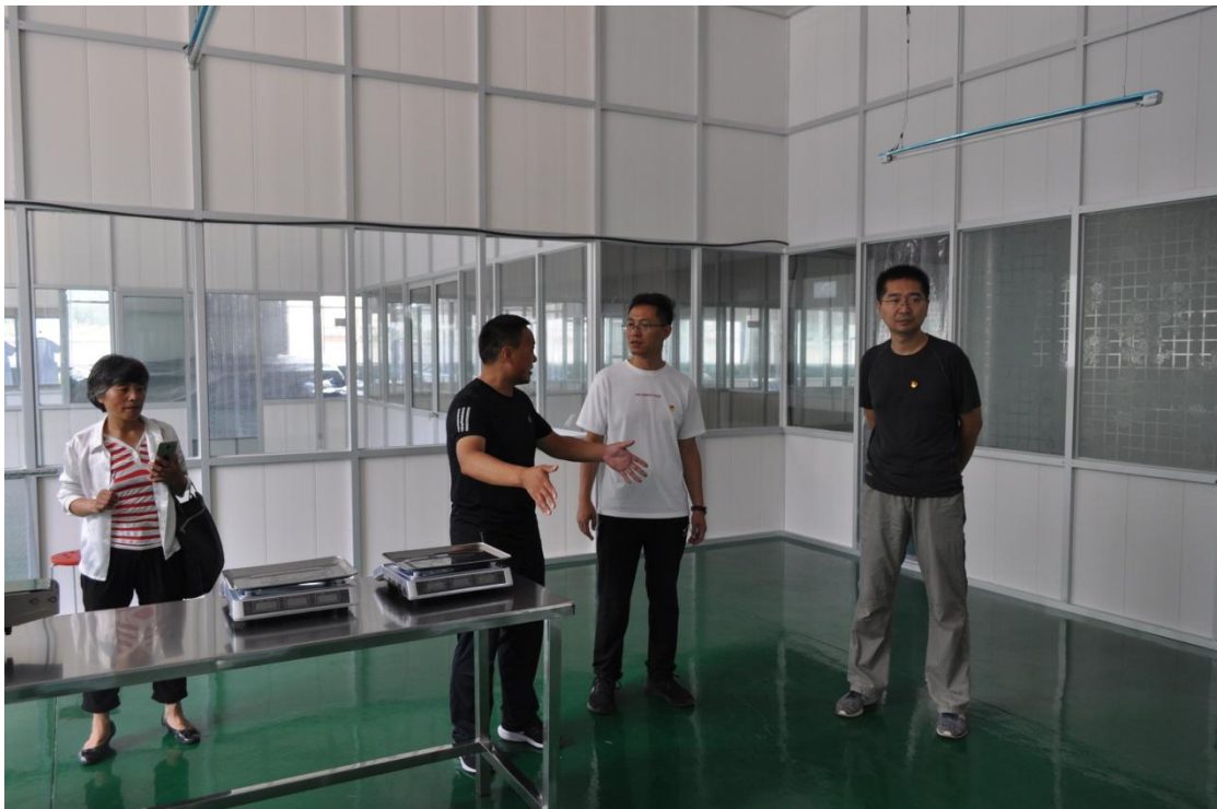
图二：考察扶贫车间运转情况