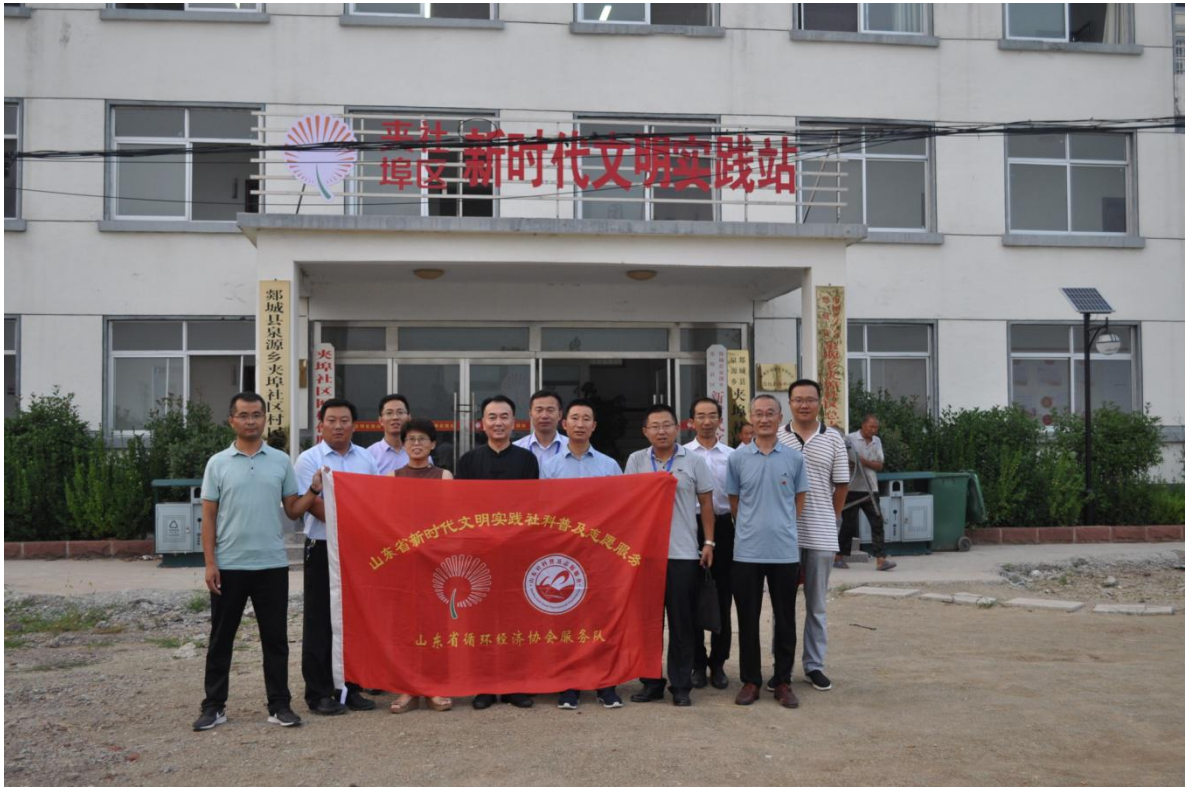
图三：志愿服务队在社区前留影