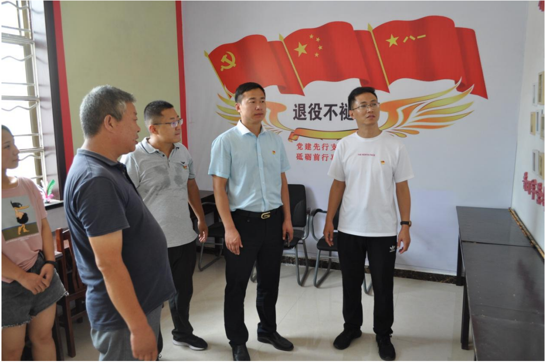
图三：考察科技村退役军人服务站