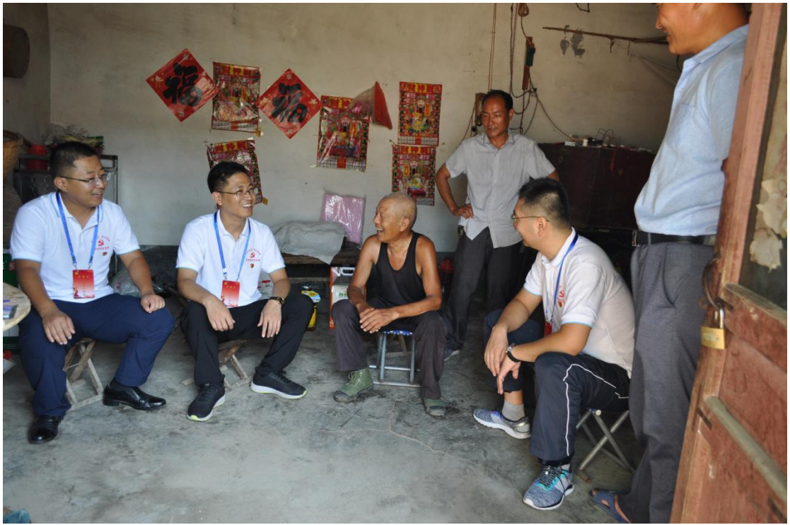
图三：慰问退役军人