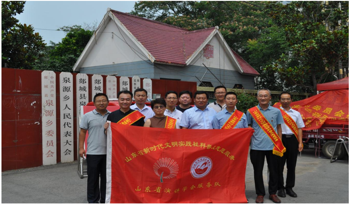
图一：服务队走进郯城县泉源乡