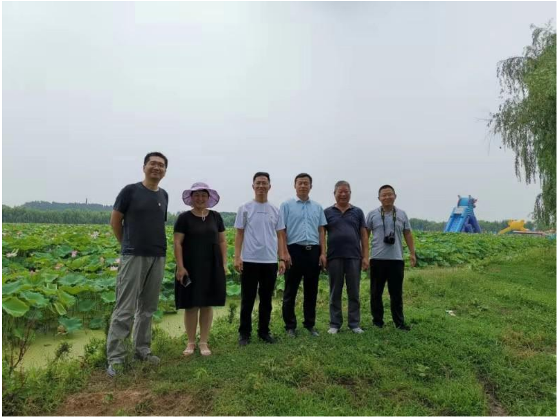
图一：考察观赏藕种植基地