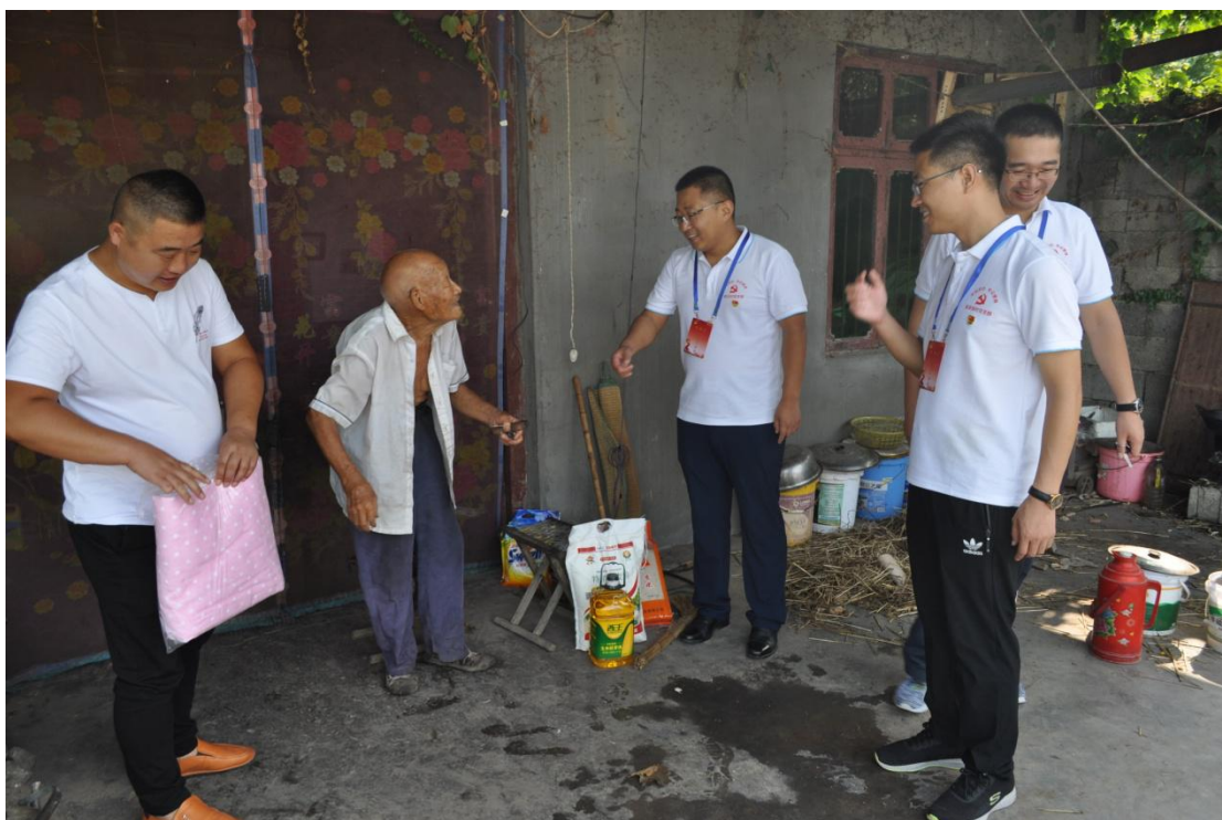
图二：慰问退役军人