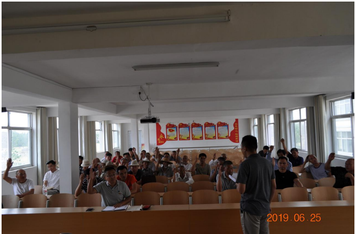
图三：房庄村党支部组织发展预备党员