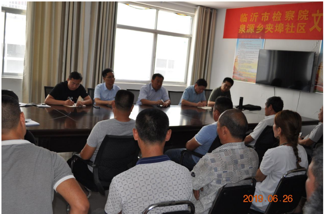
图四：组织产业扶贫对接会