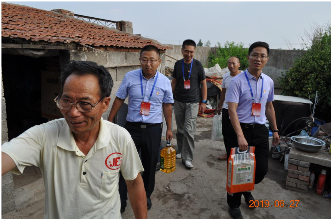
图七：走访慰问困难党员