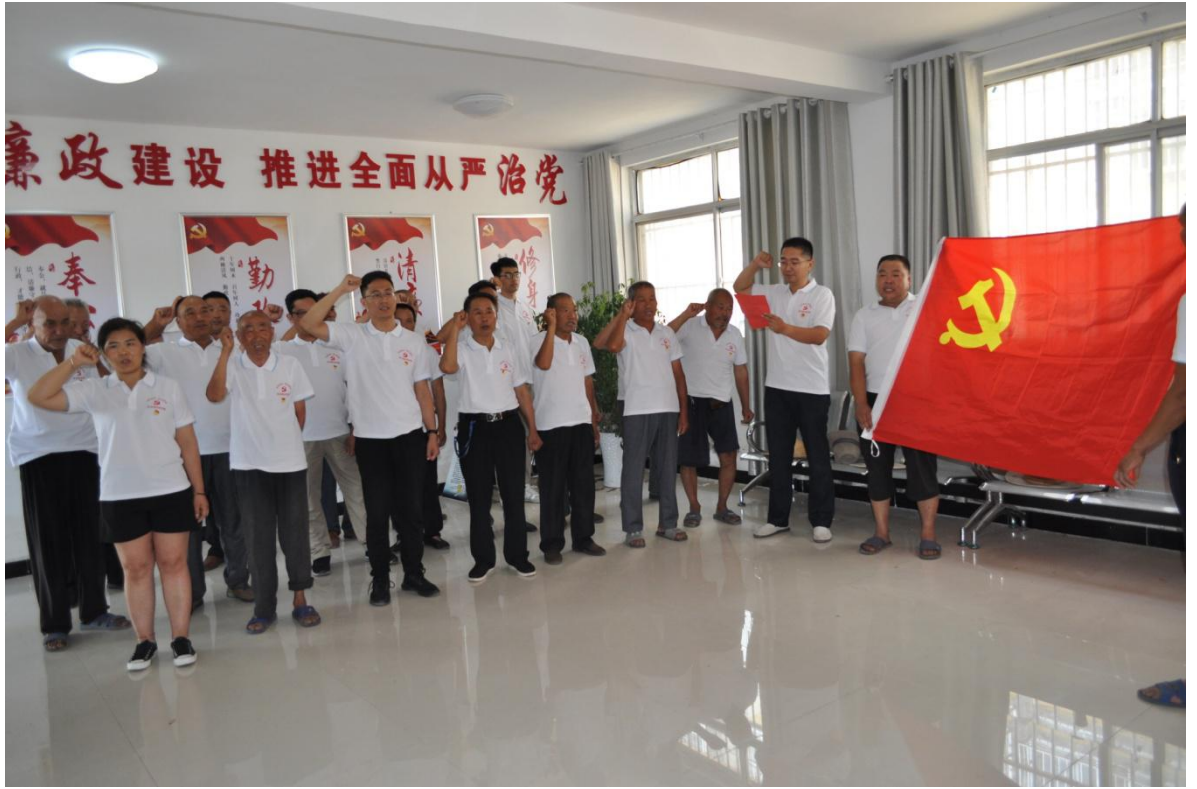
图二：东夹埠村党支部组织重温入党誓词