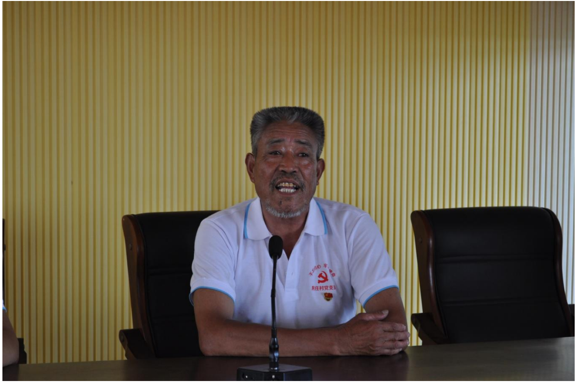
图八：优秀党员座谈交流