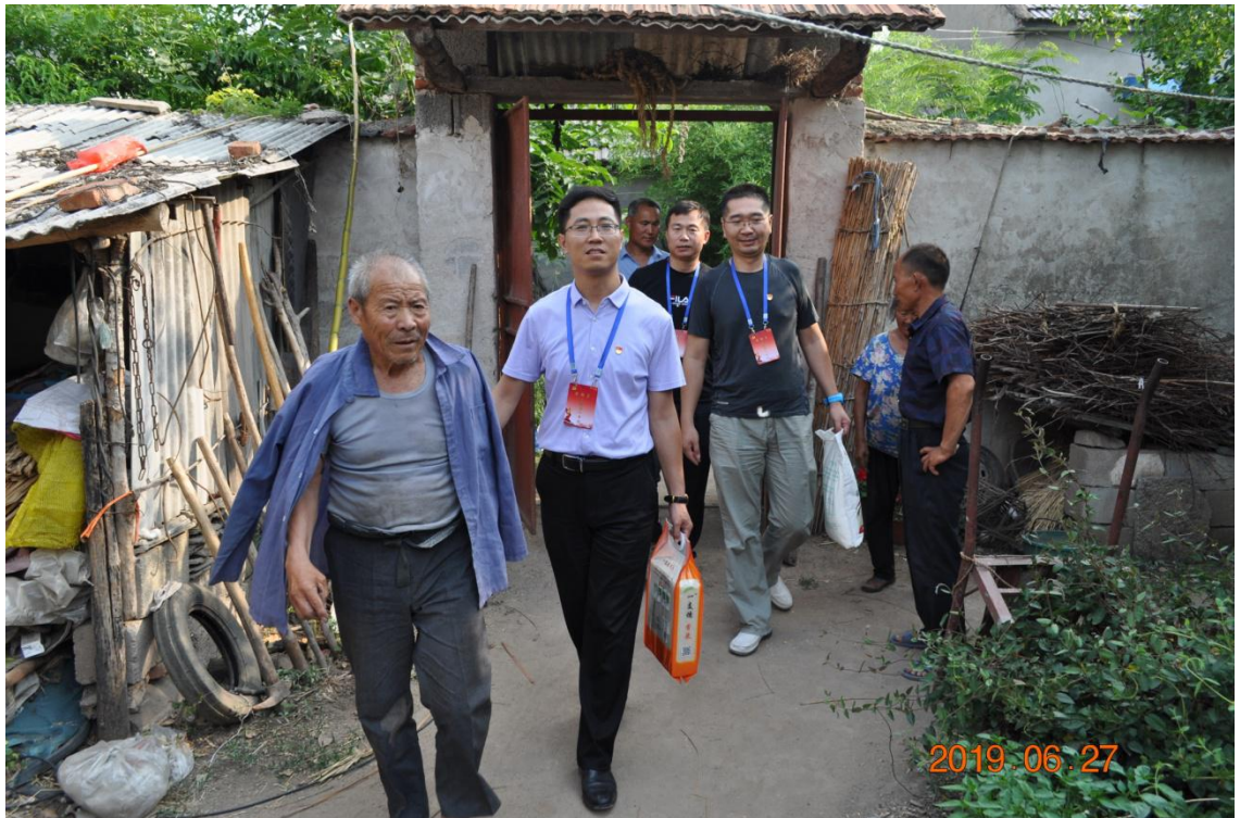
图五：走访慰问困难党员