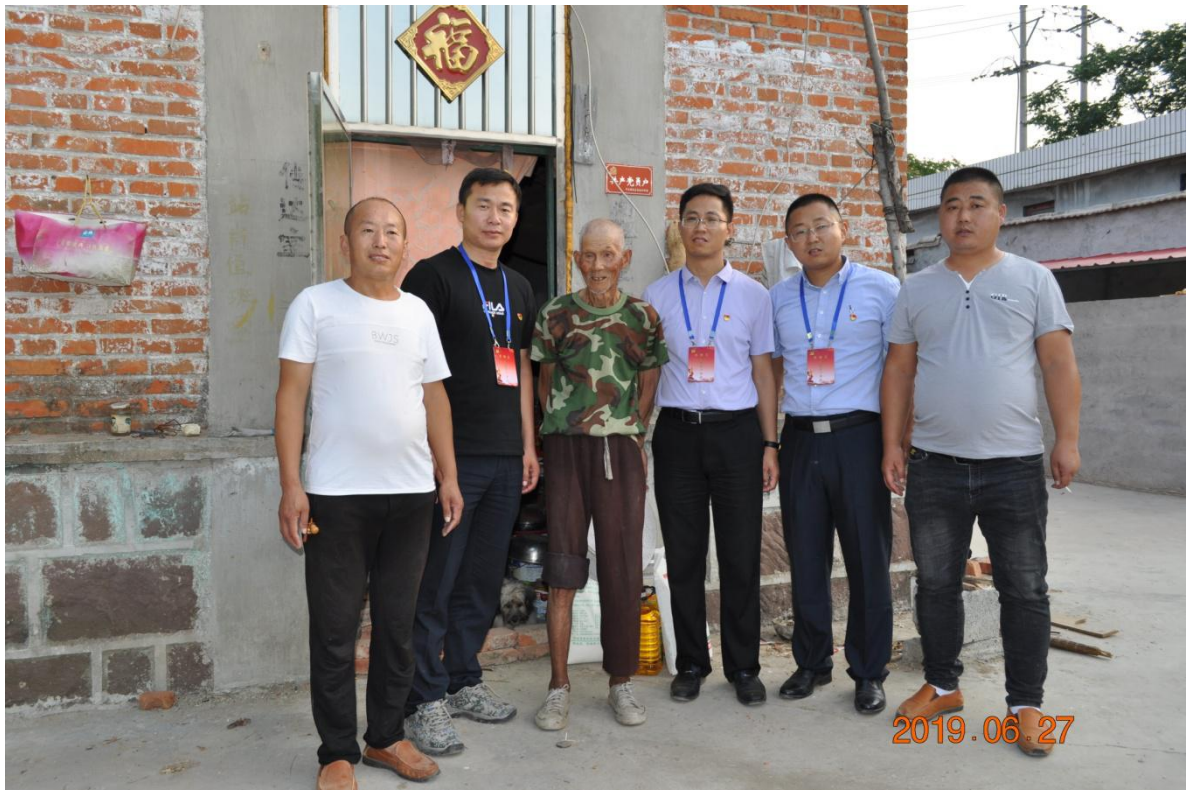
图六：走访慰问困难党员