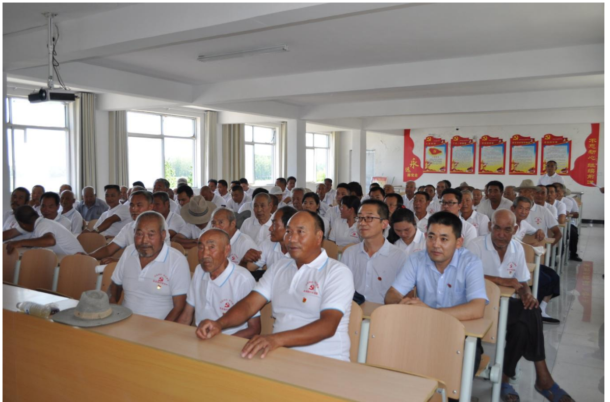
图九：召开党员大会