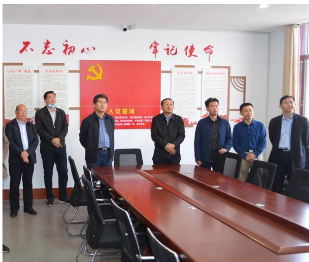
交流村党支部建设经验