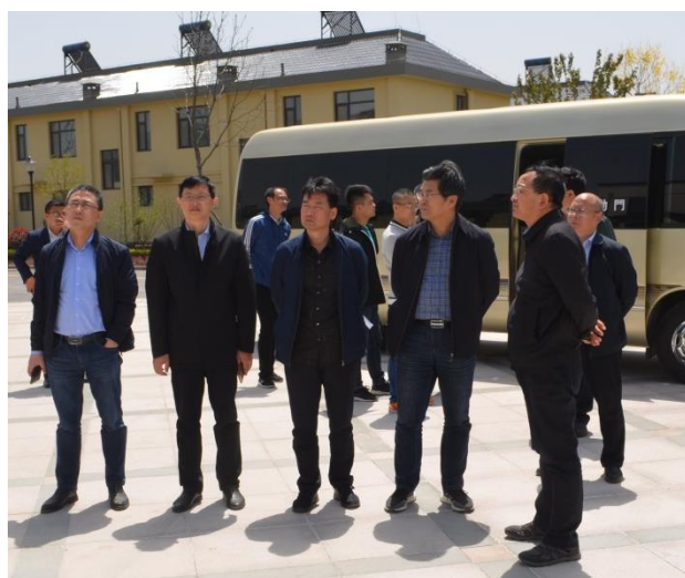
考察学习合村并居经验