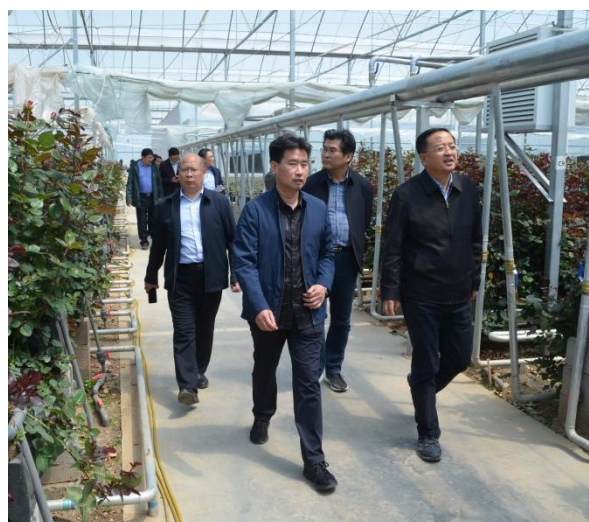
考察学习玫瑰产业项目