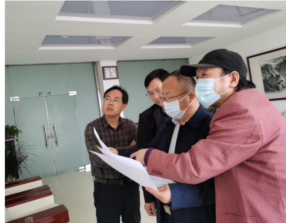
与专家研究农业地质项目