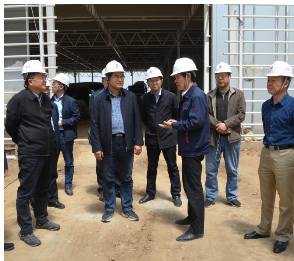
考察京鹏设施农业项目