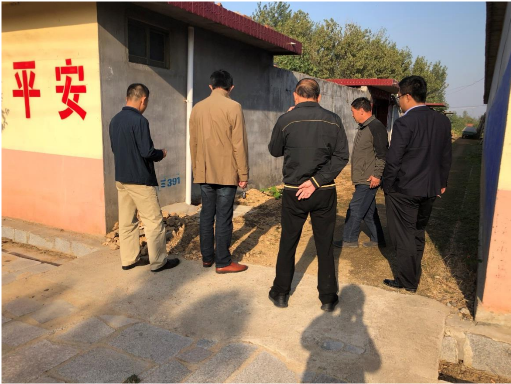
服务队入村研究改厕和“户户通”实施方案