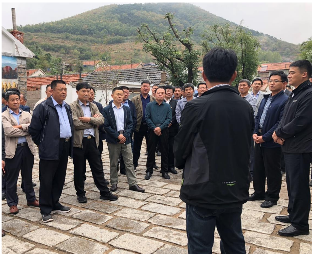
服务队队员与村干部到五莲县省级美丽乡村学习建设经验

服务队同志与镇村干部到周边县区省级美丽乡村参观学习建设经验，结合村镇实际制定美丽乡村建设方案，紧紧围绕“生态宜居村庄美、兴业富民生活美、文明和谐乡风美”的工作思路，推动农村生产美产业强、生态美环境优、生活美家园好“三生三美”融合发展，全力打造惠及全体村民的美丽乡村示范点。