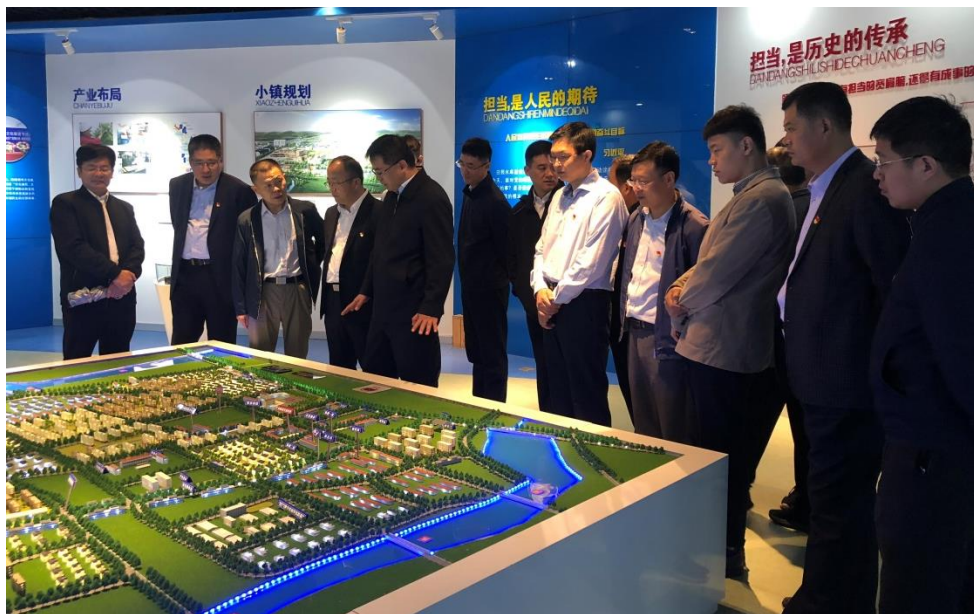
参观日照水库移民精神记忆馆

10月10日，乡村振兴服务队同各村党支部书记到日照水库移民精神记忆馆和八路军驻日照办事处滨海军团六团纪念馆参观学习。通过参观学习提升党员干部精气神，激发党员干部干事创业激情。在八路军驻日照办事处滨海军团六团纪念馆听老支部书记讲述红色峥嵘岁月，全体党员干部重温入党誓词，坚定理想信念。