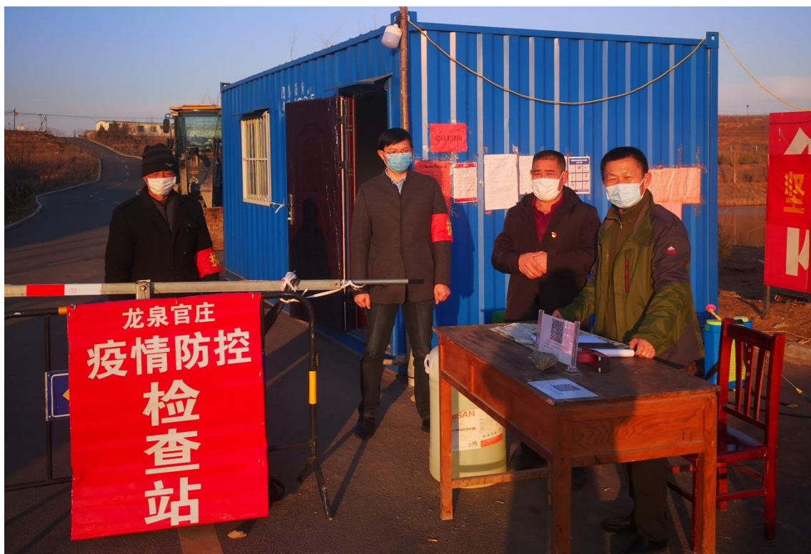
服务队员轮班到疫情防控检查站值班值守

在村口、主要路段、重点区域疫情防控检查站，安排工作人员全天候值班值守，对来往人员、车辆等进行逐一登记、检查、消毒等，对不符合入村条件人员给予劝返，坚决阻断疫情向村内蔓延。对全体村民开展有关疫情防御知识宣传，讲解科学防控知识，引导他们做好科学防范，增强自我防护意识，提高自我防护能力。对贫困群众存在的年纪较大、免疫力较低、行动不便等人员，安排专人“一对一”帮扶，解决生活中的困难。另外，服务队全体同志向三庄镇捐赠价值10000元的棉帽和手套等保暖和防护用品，给防控一线的干部群众送去温暖。