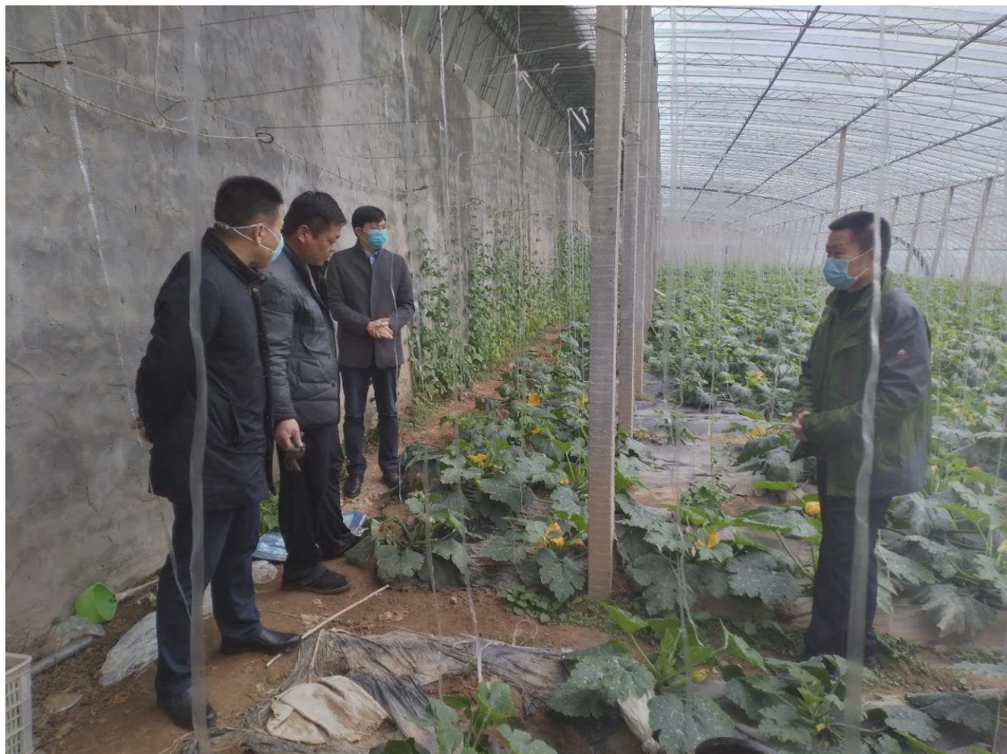
服务队到帮包户大棚调查疫情期间蔬菜销售情况