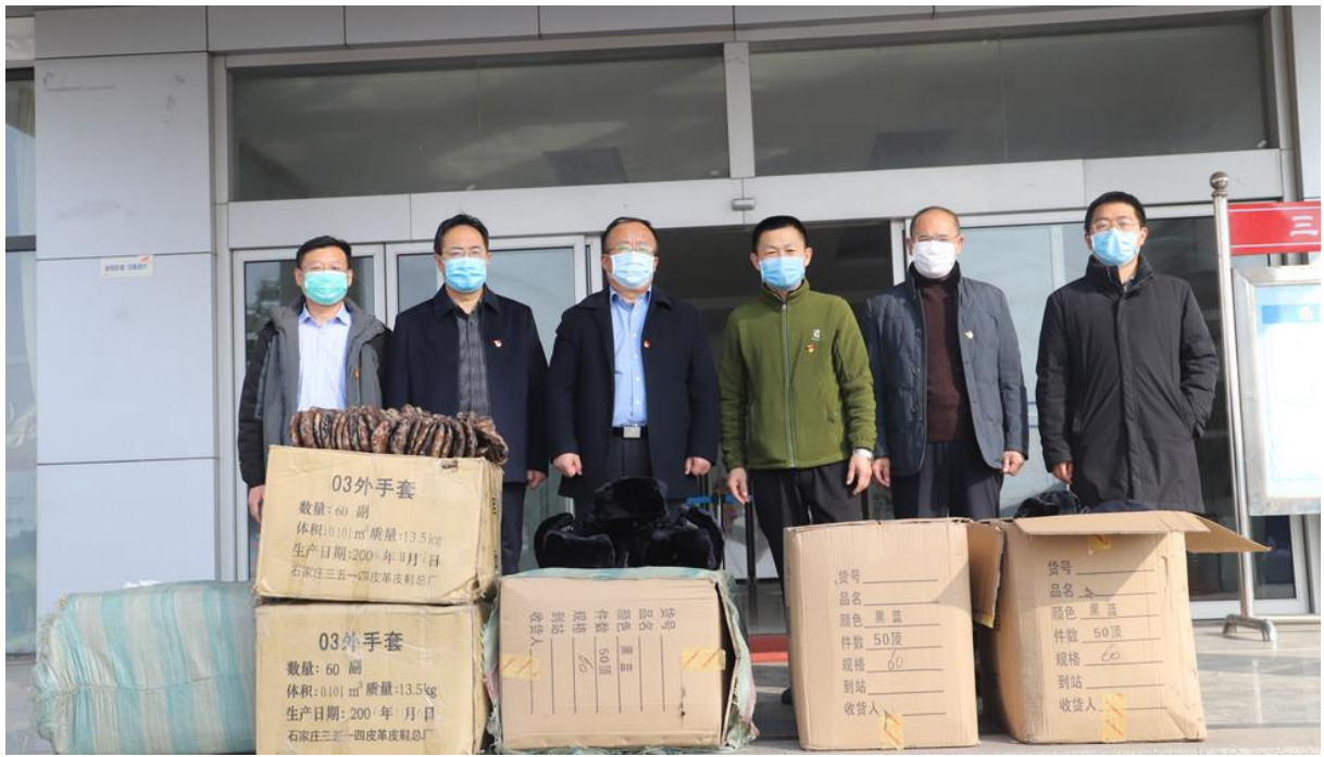
服务队同志捐赠棉帽和手套等保暖和防护用品