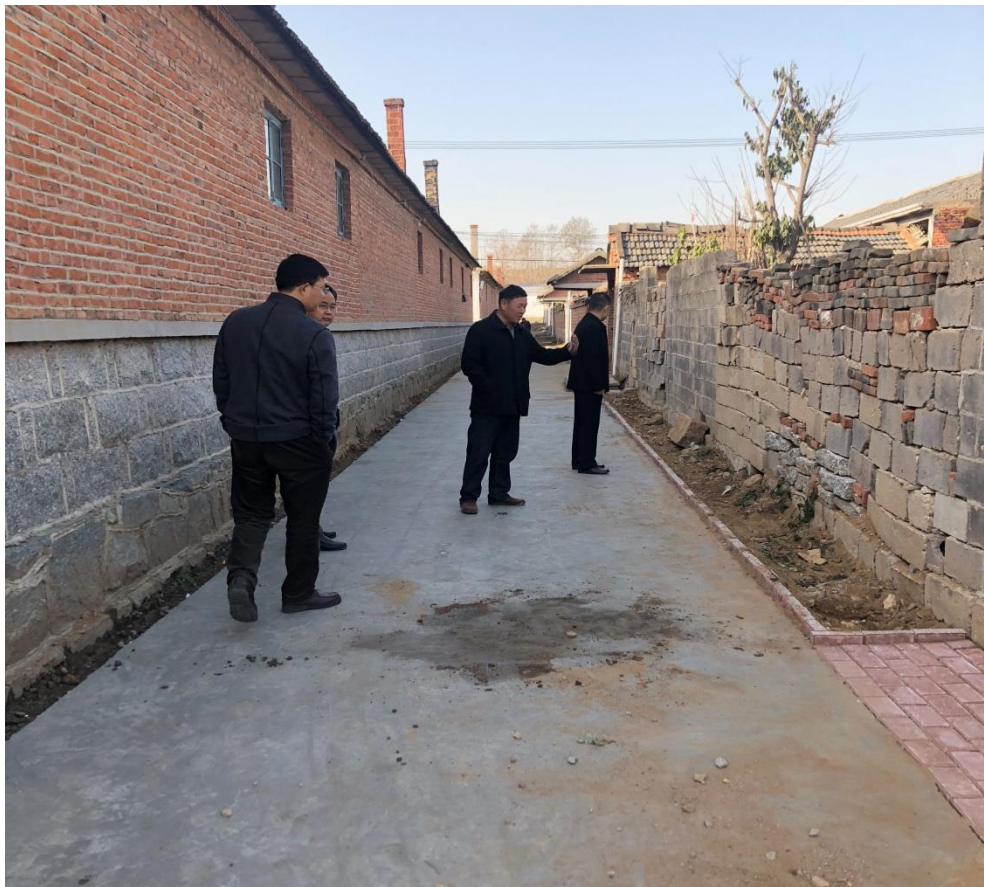
即将完工的“户户通”工程