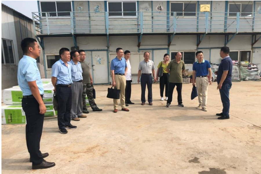
考察邱前村怡和食品蔬菜基地

7月24日-25日，省派日照市三庄镇乡村振兴服务队到邱前村、大王家寨村、龙泉官庄、下卜落崮村、讲合沟村5个村进行现场调研。听取了各村两委对本村情况介绍和乡村振兴发展规划，现场考察了邱前村怡和食品蔬菜基地、大王家寨山东港荣食品有限公司和规划建设物流中心区域、龙泉官庄黄桃基地、龙门崮田园综合体等。走访调研结束后，汇总整理了调研情况，形成初步调研报告，对下一步制定乡村振兴规划方案奠定了基础。