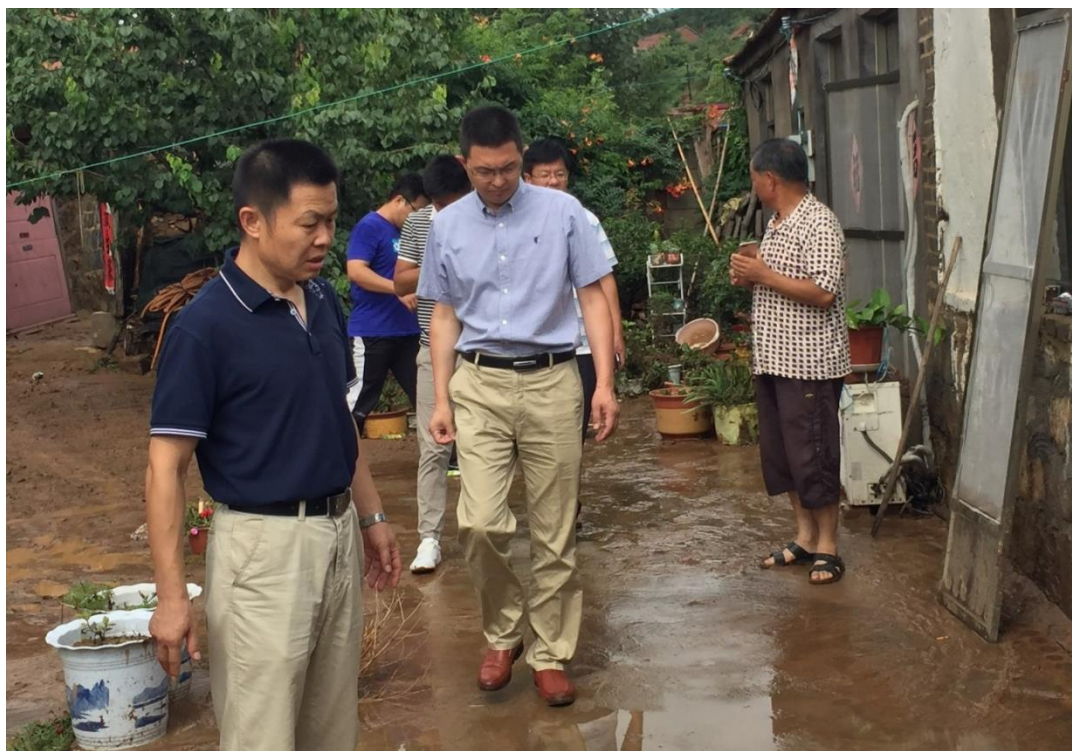
走访慰问受灾农户

8月7日，服务队到邱前村查看因暴雨损坏的两座漫水桥，漫水桥损坏严重影响农民农业生产和安全。服务队与村干部对漫水桥损坏情况进行初步判断和修复方案，及时与乡镇沟通，争取尽快修复，帮助村民恢复农业生产。